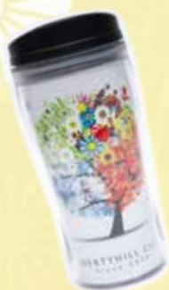
LHCオリジナル タンブラー2本セット

3つの中から、ご希望のリバティヒルクラブ オリジナルグッズ1つをお選び頂けます。