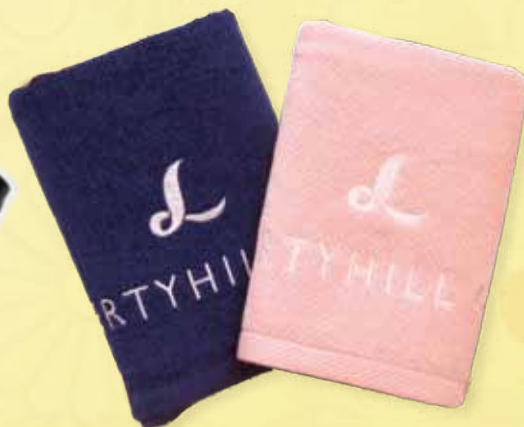
LHCオリジナル スポーツタオル2枚セット