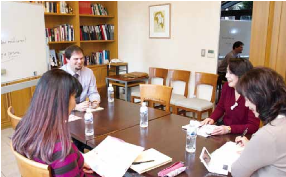
日常の出来事など、楽しい会話を通じて、少しずつフランス語が上達します。 J'étudie toute ma vie.