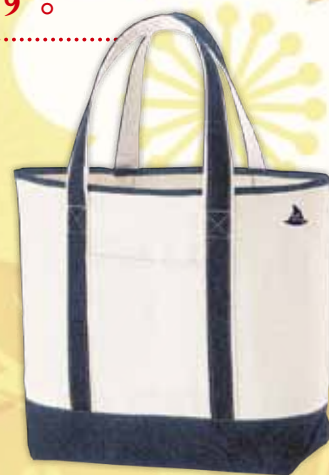
LHCオリジナル トートバッグ