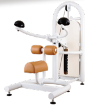
ボディメトリクス