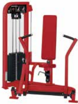
ウェイトトレーニングマシン