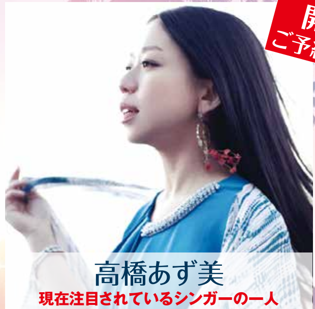
高橋あず美 現在注目されているシンガーの一人

国内外のマジックコンテストにて、数々の賞を受賞。 2014年、クローズアップマジックにおいて世界的権威の アメリカの団体FFFF(フォーエフ)から修士号であるMaster 称号を取得した世界的なマジシャン。