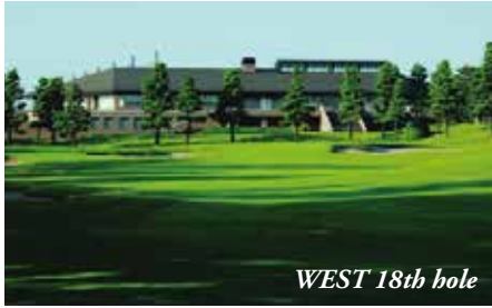
WEST 18th hole