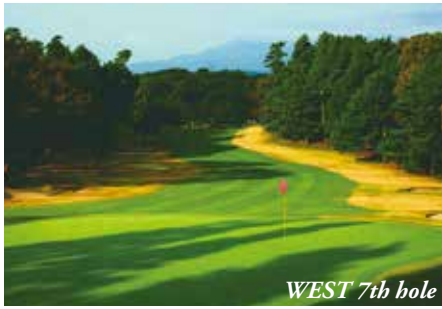
WEST 7th hole