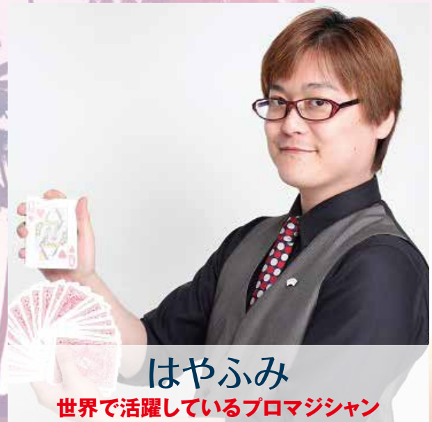
はやふみ 世界で活躍しているプロマジシャン