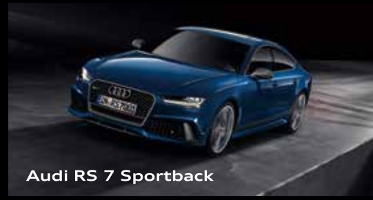
Audi RS 7 Sportback