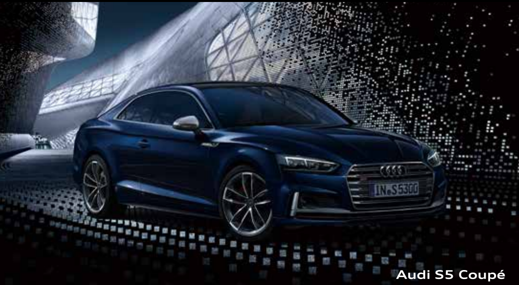
Audi S5 Coupé