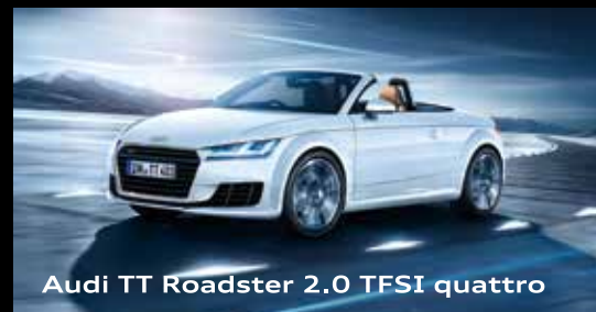
Audi TT Roadster 2.0 TFSI quattro

リバティヒルクラブ会員様に特別にお届けする、Audi 出張展示会。 9年ぶりのフルモデルチェンジで、美しさに躍動感も加え進化した新型 Audi S5 を デビューフェアに先駆け、いち早くご覧いただけます。 Audi ならではのスポーティなモデルを是非この機会にご体感ください。