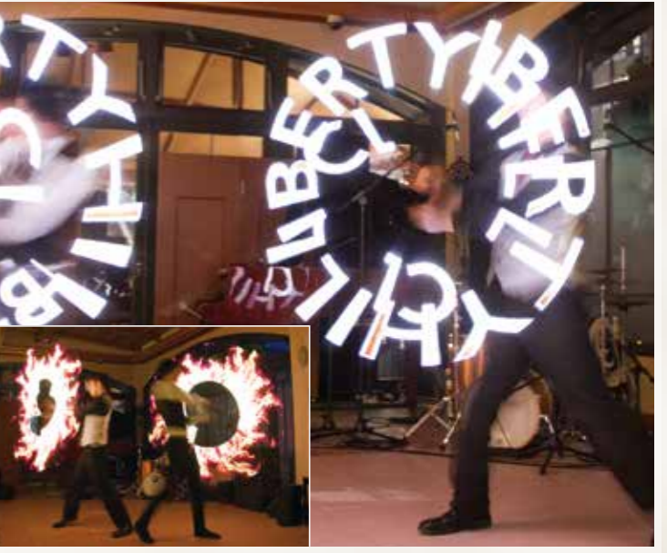
特殊なLED基盤をポイに組み込み、音楽とシンクロさせて、空中に画像や文字を描いていく、最新ジャグリング。紅白歌合戦等の振付・演出を手がける「ポイラボ」から「KiM」「Akira」のお二人を迎えてのパフォーマンス。最後は当クラブのロゴマークが現れ、会場は驚きの声が上がりました。