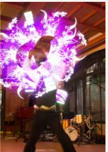
マオリ族の男性がトレーニングの道具として使っていたポイを起源とするグラフィックポイ。