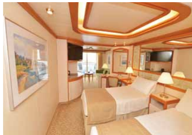
一番のおススメ! ジュニア・スイートのお部屋