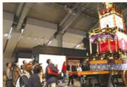
▶神田明神山車にて説明に聞き入る様子