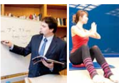
フランス語講座、 絵手紙教室等の ショートレッスン ヨガをはじめ、 多彩なフィットネス プログラム