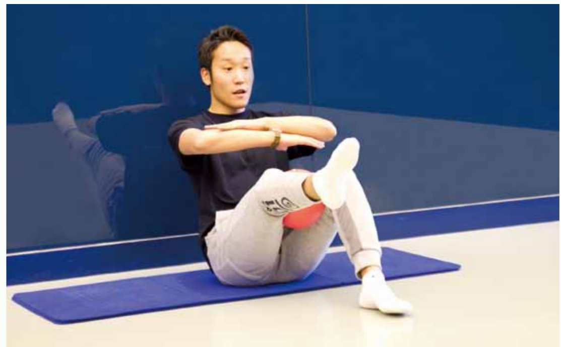
最近人気急上昇のコアトレーニング。正しい姿勢で、呼吸を意識する事が大切です。ミニボールだけでトレーニング出来るので、ご自宅でも手軽に行えるのも魅力の一つ。

リバティヒルクラブ9年勤務 BESSJ認定マットピラティスインストラクター NASM-PEES