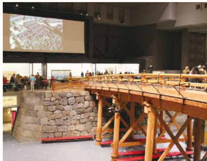
▲実物大に復元された日本橋