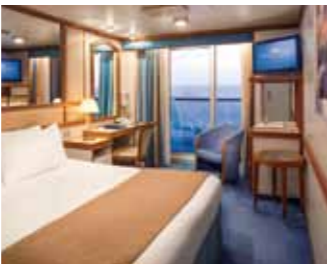
海側バルコニー付のお部屋

全て客室に、電話、ヘアドライヤー、シャンプー、コンディショナー、ボディローション、石鹸をご用意しております。バスローブ、シャワーキャップが必要な方は客室係にお申し付け下さい。