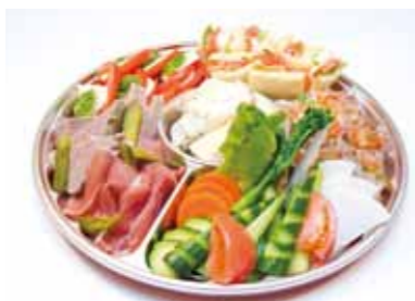
パーティプレートB