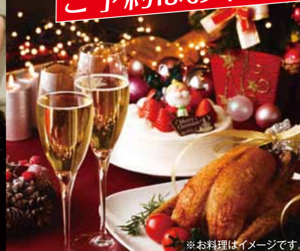
※お料理はイメージです。

今年のクリスマスパーティーは、着席式ですので、ゆつくりとダイナーとショーをお楽しみ頂けます。 ダンスパフォーマンスは、サンデー・スペシャルで人気を博している「ショースタージヤズ」の朝純真世あきさみまじ氏が、バックダンサーを率いて登場します。 また、ミュージックライブでは、ベーシスト・プロデューサー等才能溢れるボーカリスト、ウォーネル・ジョーンズを迎えてのライブをお楽しみ下さい。モンレー・ジャズフェスティバル出演をはじめ、松田聖子等、国内外のトップアーティストとの共演多数の実力派シンガーです。 今回は、ピアノ・サクソフーン・バックコーラスの生演奏で、聖なる夜を盛り上げます。 また、ラウンジファイガロのシェフが腕によりをかけたフレンチフルコースもご堪能下さい。 ご家族だけでなく、日頃懇意にされているご友人の方々もお誘い合わせの上、ご参加をお待ちしております。お席に限りがございますので、お早めにご予約下さい。 日時 2015年12月19日(土) 開場 18時 開演 18時30分 終演 20時30分予定 参加費 一人様 ¥14,040(税込) ※小人も同額です。※3歳以下の方はご参加頂けません。 *フロントにて、参加費と合わせてお申込み下さい(現金・カード・チャージのいずれか)。お支払いがお済み次第、お席を確保させて頂きます。(お申込みのみ場合は、お席の確保は致しかねます。) 形式 着席式フレンチフルコース ドレスコード セミフォーマル(ジーンズ不可) 定員 先着55名様限定 お申し込み締切日 2015年12月18日(金) *ゲストの方もご参加頂けます。 *お申し込み・お問い合わせは、フロントまでお気軽にどうぞ。