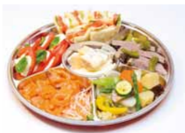
パーティプレートA

※ご指定頂いたお時間にお作り致します。 ※数に限りがございますので、ご予約はお早めに。 ※お申し込み・お問い合わせは、ラウンジフィガロまで、お気軽にどうぞ。