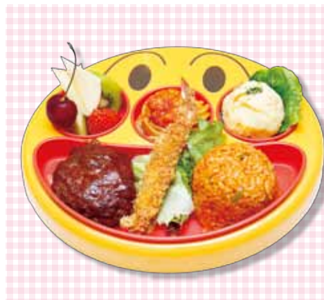
お子様アンパンマンプレート ¥1,980(税込¥2,134)