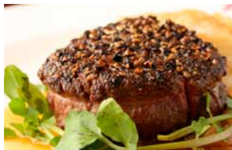
和牛フィレのペッパーステーキ