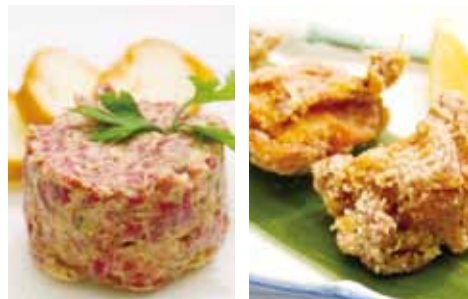
和牛フィレ肉のタルタルステーキ 大地鶏の唐揚げ