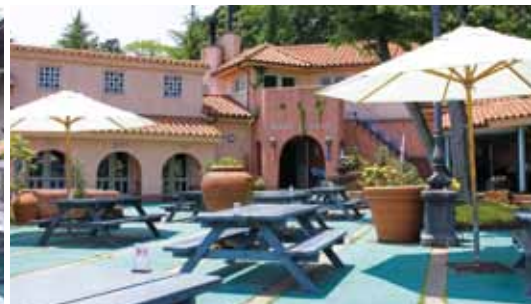
ロペ倶楽部テラス