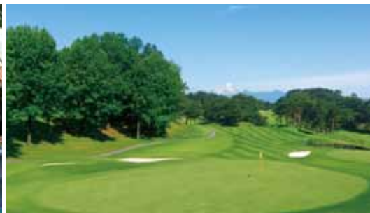
千成ゴルフクラブ