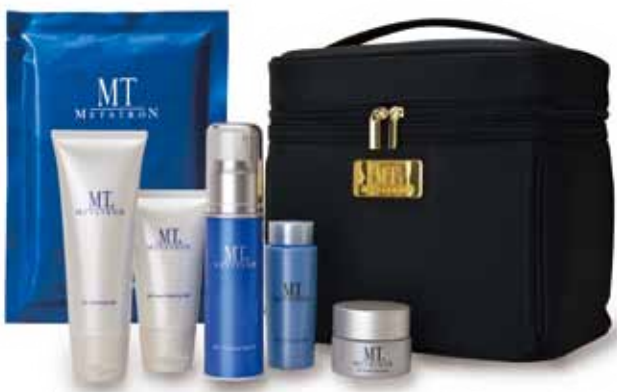
通常価格 ¥20,000 ▶ 特別価格 ¥12,960(税込)

エッセンシャルセラムは、コラーゲンを生成する働きに着目した、真の肌弾力を取り戻すリフティング美容液です。今回、数量限定で、エッセンシャルセラムのプレミアムコフレを販売致します。数に限りがございますので、お早めに!!