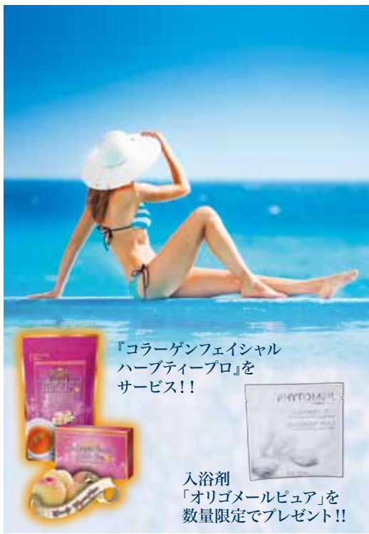
『コラーゲンフェイシャル ハーブティープロ』を サービス!!