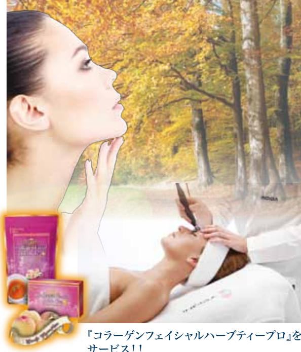
『コラーゲンフェイシャルハーブティープロ』を サービス!!