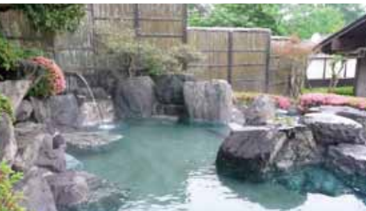
ロペ倶楽部天然温泉