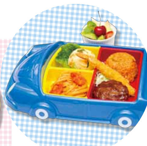
お子様カープレート ¥1,980(税込¥2,134)

※お料理の内容は、イメージです。季節や仕入れの状況により変わります。 ※お問い合わせは、ラウンジファイガロまでお気軽に。 ※3歳未満のお子様は、保護者の方のご同伴にて、スイートルームでの利用とさせていただきます。