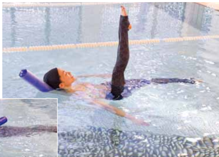
浮き棒を使い、ピラティスの要素も取り入れた独自のレッスン。アクアビクスとの組み合わせでさらに柔軟性が高まります。

■ どんなクラスですか？ 「アクアビクス」音楽に合わせ、水の特徴を活かしながら、水中で全身運動を行います。 「ボディコントロールアクア」浮き棒(ビニール状の浮き棒)を利用して、姿勢矯正・コアコントロールを行います。トレーニングの要素だけでなく、浮き棒に身体を委ねる事で、リラクゼーション効果も高いレッスンです。 ※アクアビクス・ボディコントロールアクアのどちらかご参加も可能です。 ■ どんな効果が期待できますか？ 「アクアビクス」水中では、陸上よりも膝腰に負担なく身体を動かせます。そして、心肺機能向上と筋力アップが図れます。 ■ こんな方にオススメです!! 「アクアビクス」●膝腰への負担を少なく筋力アップしたい方 ●ダイエットしたい方 ●泳げないけれど水中運動をすすめられている方 ●体調に合わせてご自身で強度を調節したい方 「ボディコントロールアクア」●バランス感覚を向上させたい方 ●柔軟性を高めたい方 ●身体の動かし方や癖を意識してみたい方 ●他の運動のサブトレーニングとして