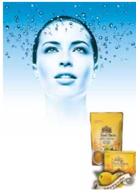
季節系ハーブティ『A-クリア』をサービス！ 季節のムズムズにアプローチし、 スッキリをサポートするハーブ全31種配合。 花粉症対策・免疫力UPにも効果的です。