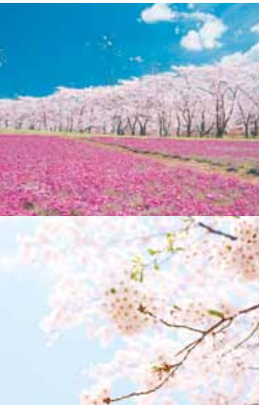
桜のトンネルと、芝桜のカーペットを楽しむ春のお花見バスツアー。