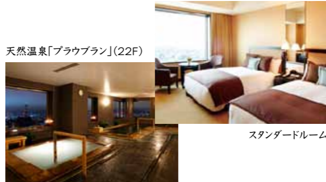
天然温泉「プラウプラン」(22F)