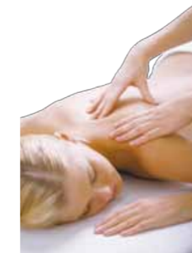
インディバの後、アロマオイルにてマッサージを行い、老廃物の排泄を促します。

インディバスリミングは、副交感神経を刺激し、受けている多くのお客様から、ぼかぼかと暖かく、まるで人の手で優しく施術されている感覚の気持ちよさがあるというお声を頂きます。また、発汗を促し、インディバで燃焼された脂肪やセルライト、体に溜まった老廃物が排出され、「デトックス」効果も抜群です。