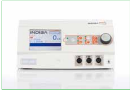
インディバアクティブ用機器

て体の外にあります。「体の芯まで温まる」感覚は、温泉のお湯の温度が体の中にしみ込んできたのではありません。皮膚表面の近くまで来ている毛細血管が、体外の温泉の熱を吸収し、温かくなった血液が徐々に体内の血管に運搬され、数十分もすると体全体の血液が温まりそれを「芯まで温まる」と感じていたのです。