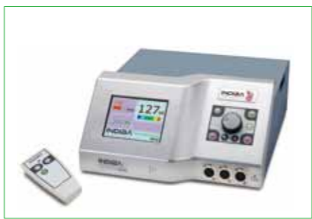
インディバスリミング・フェイシャル用機器