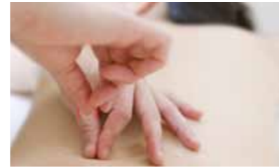
症状に合わせて、マッサージや鍼を組み合わせます。

従来のマッサージでは難しかった深部組織(軸筋群や付属筋群、骨・関節等)までをターゲットにし、ケガや痛み予防、早期の徐痛や組織の改善、可動域の改善、疲労回復を促します。また、受傷直後からの非熱作用を使った治療も可能で、血管・リンパ系、細胞膜電位、末梢神経に働きかけることによって、損傷部位の痛みや腫脹・炎症を緩和します。