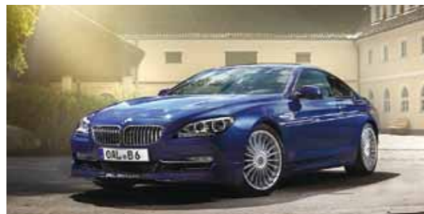
B6 BiTurbo Coupé

世界的に権威ある英国の自動車専門誌「AUTO CAR」で世界最速のディーゼル・リムジンと評されたBMW ALPINA D3 BiTurbo Limousine。パワーも燃費も環境も高次元で融合した真に見識深い方々に感銘を与える車です。B6 BiTurbo Coupéと併せて、是非この機会にALPINAの真価をお確かめください。