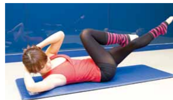
アップテンポのレッスンが苦手な方、是非、ご参加を。

姿勢改善(身体の歪みを直す)をはじめ、血液循環機能、免疫力アップ、柔軟性向上、筋力向上、ストレス解消、ダイエット、腰痛改善等に効果的です。 立って行う運動やアップテンポの有酸素運動が苦手な方には、特にオススメです。