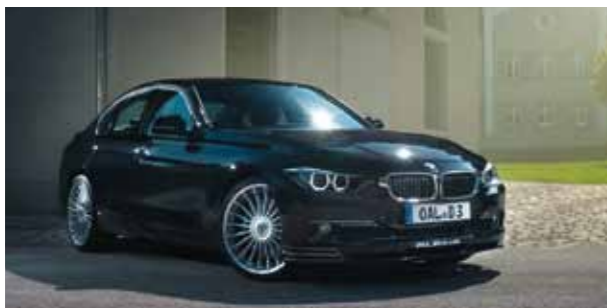
D3 BiTurbo Limousine

2014年4月7日(月)・8日(火) 10:00~17:00 リバティヒルクラブ駐車場にて