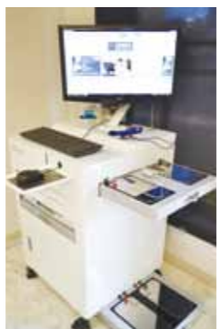
エレクトロセンサー「J-SKY10-EX」 FDA(米国の厚生労働省)にも認可され、現在注目されている新時代の医療機器。