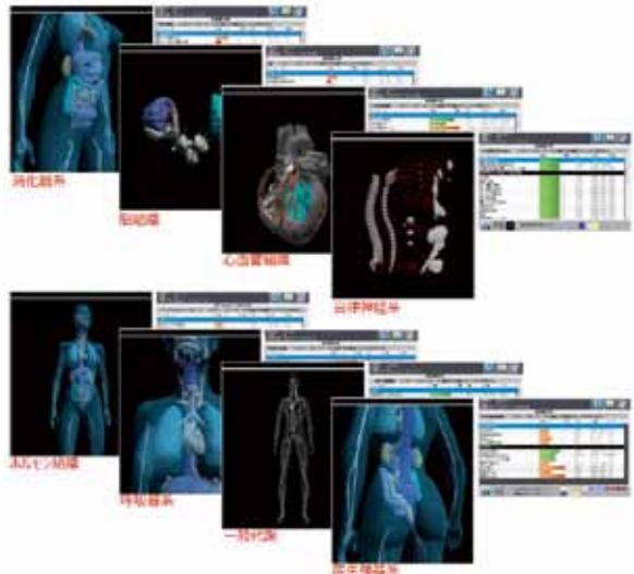
健康状態を「数値」「グラフ」「3D画像」で解析します。