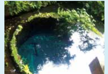
クレマチスの丘の花々(左)と柿田川公園第2展望台の湧水(右)