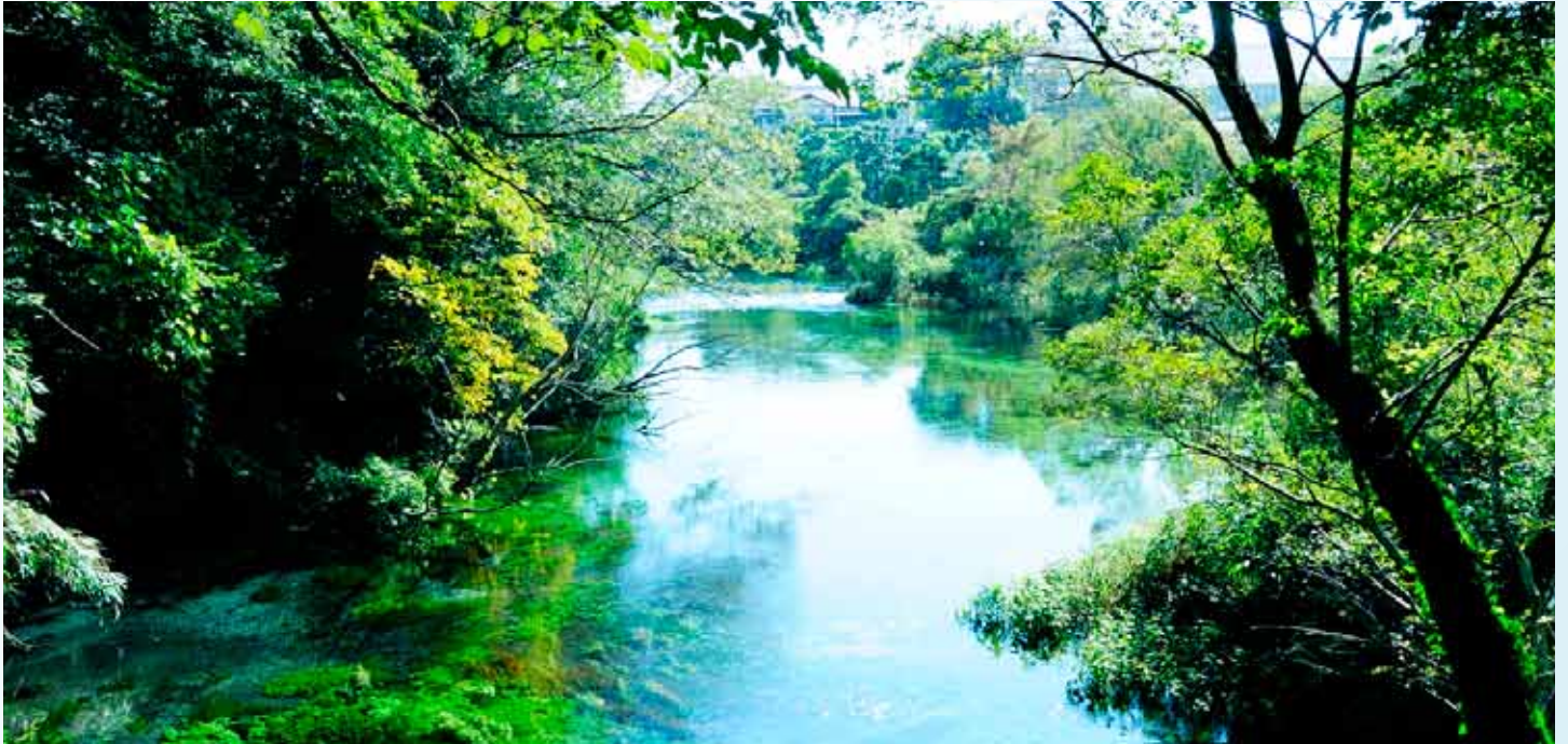
木々に囲まれた柿田川湧水群

毎年恒例のバスツアー。今年は富士山麓の見晴らしの良い丘陵地にある「クレマチスの丘」で、現代彫刻とクレマチスガーデンを見学し、続いて日本三大清流の一つである柿田川湧水群を散策しました。