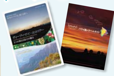
「ハワイ島トラベルガイド」(右)と 「ディープ・ハワイ・エコツアー」(左)を エントランスにて配布中!!