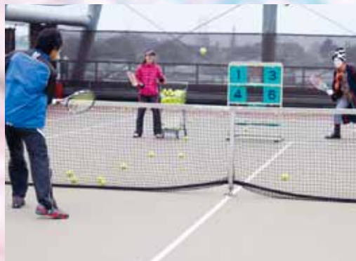
テニスレッスンの最後は、恒例の「ストラックアウト」ここでも、ピエロが出没。