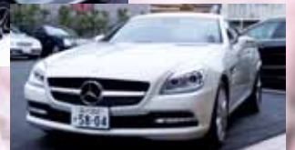
Mercedes-Benz特別試乗会に展示されたNew A-ClassとNew SLK-Class。