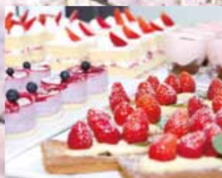
大勢のお客様で賑わった大好評の「限定!春のランチビュッフェ」。各種取り揃えたデザートも人気でした。