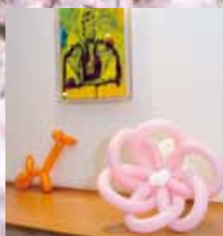
エントランスにてピエロの製作した「バルーン」