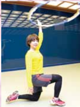
サンデーズスペシャルでも好評の「フラフープエクササイズ」も今回のイベントに登場。