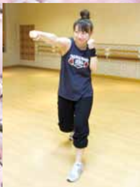
ストレス解消に効果的な「ファイティングエクササイズ」