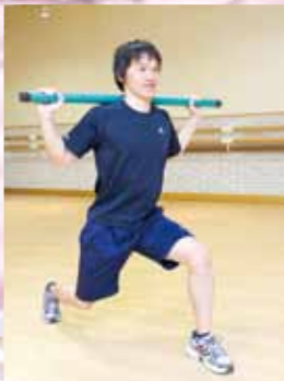
ダンベルやバーを使った「シェイプアップ健康体操」