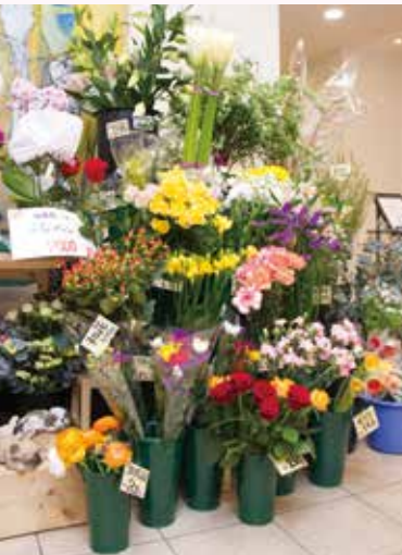
切り花や枝物も豊富に取り揃えています。