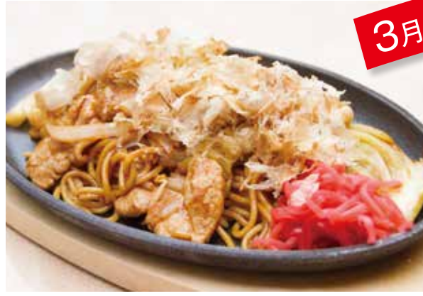
「昔ながらのソース焼きそば」

「昔ながらのソース焼きそば」 「抹茶白玉あんみつ」 「春限定 いちご白玉あんみつ」