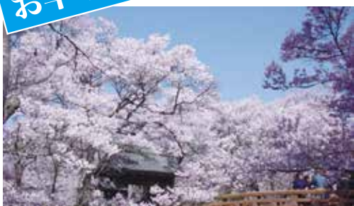
高遠城址公園内の元高遠城楼門(三の丸)の風景です。