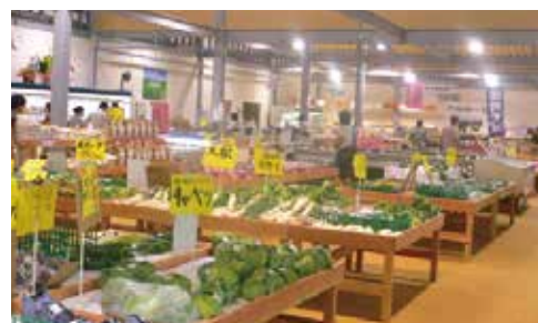
たてしな自由農園原村店」にて、新鮮な高原野菜のショッピングを!