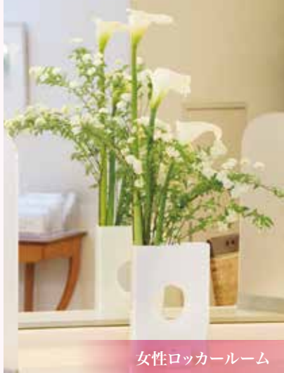
女性ロッカールーム