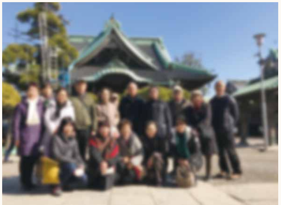
題経寺(だいぎょうじ/毘沙門天)にて

柴又は以前から行ってみたい所でした。当日は、好天に恵まれ、七福神も近くにまとまっていたので、午前中でお参りも終わりました。午後、自由行動となり、矢切の渡しに行き、参道で買い物、寅さんとさくらの銅像広場でブラブラ。それでも、陽のあるうちに、帰る事が出来、とても満足の一日でした。