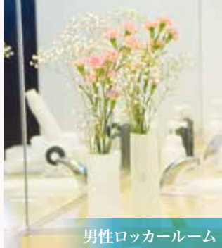
男性ロッカールーム