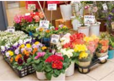
苗物や鉢物も充実しており、その日仕入れたお花も沢山！