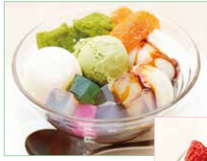
「抹茶白玉あんみつ」