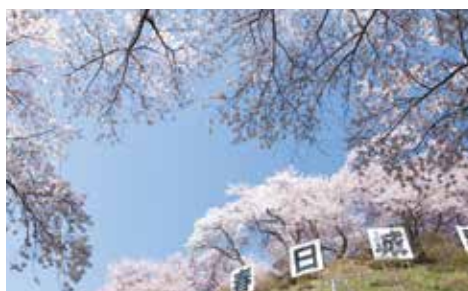
春日城址公園の麓にある「割烹いづみ」の桜ビューのお部屋にて春の旬会席料理を!