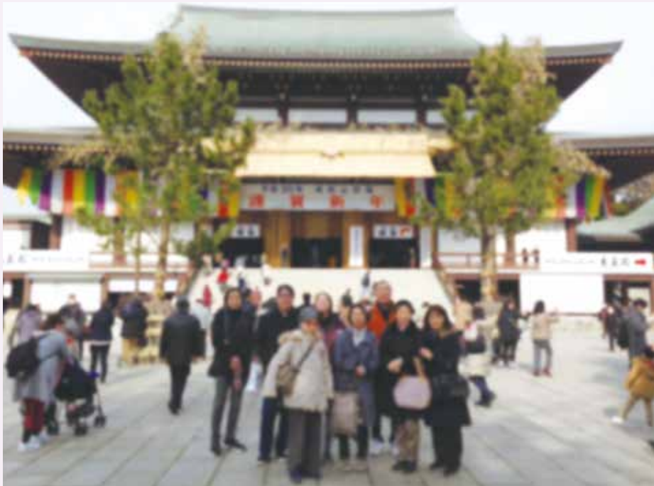
『成田山新勝寺』にて 940年に開基。11万坪の広大な境内を誇り、年間1000万人が参拝する。