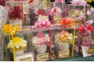
生花以外にも、プリザーブドフラワー等も多数ご用意。