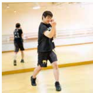
アッパー 全身の筋力をバランス良く 鍛える効果