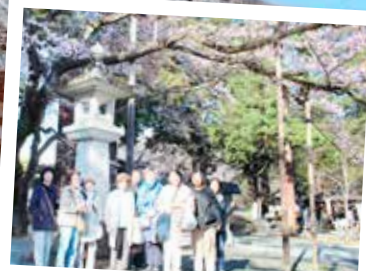
恵林寺境内の桜の木