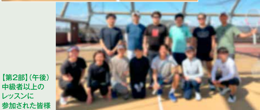
【第2部】(午後) 中級者以上の レッスンに 参加された皆様