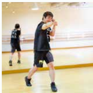
ストレート 筋力・パワー・スピードの向上、 身体を引き締め効果