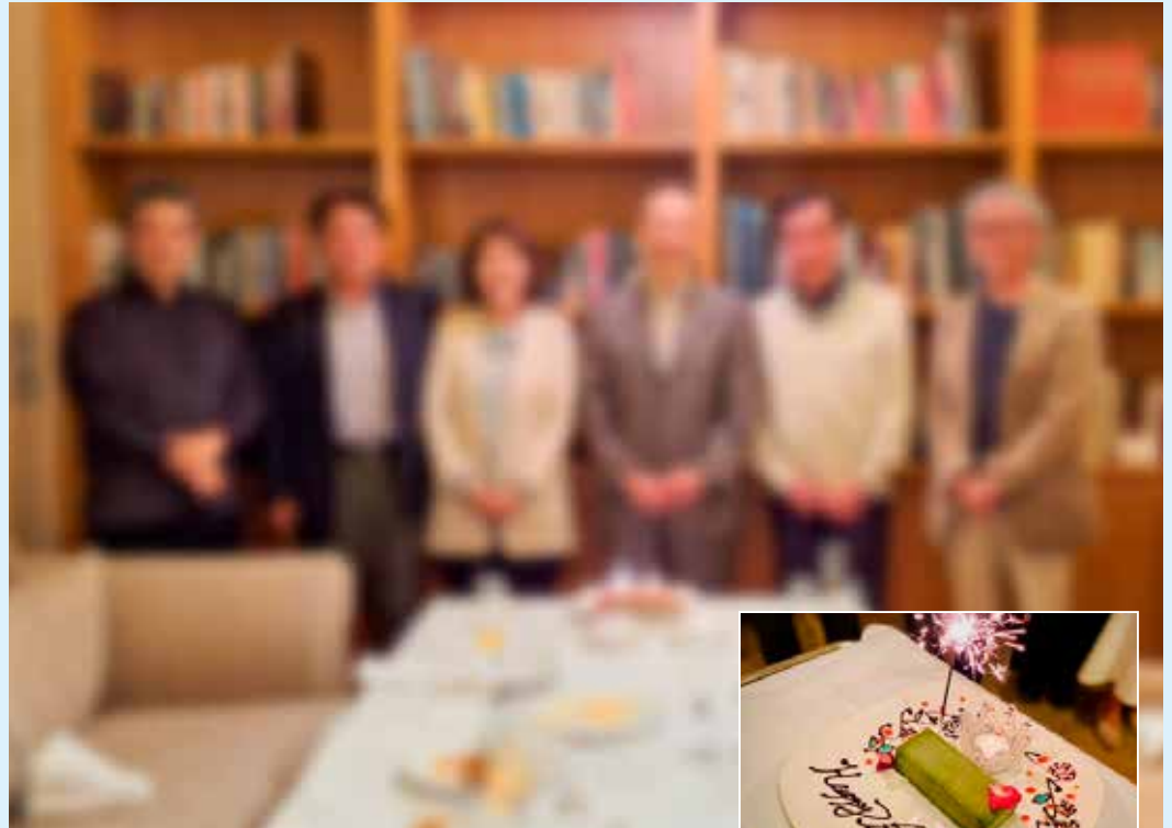
4月会にご参加された皆様(バースデーケーキを前に)

●仕事や趣味の話題まで、とても盛り上がりました。初めてお会いした方と思えない程、楽しいひとときを過ごし、あっという間の2時間でした。お陰で、たくさん飲みました。(笑)