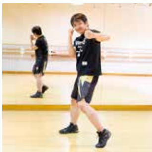
フック 全身の筋力アップ・ バランスの向上