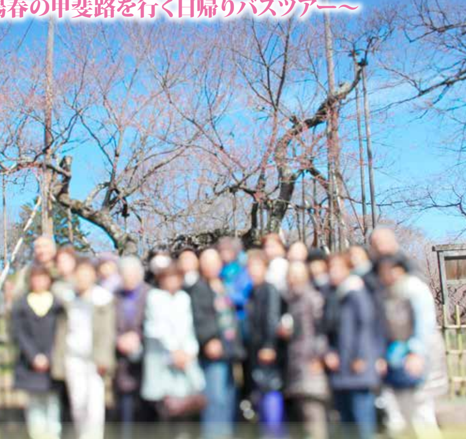
実相寺・山高神代桜にて