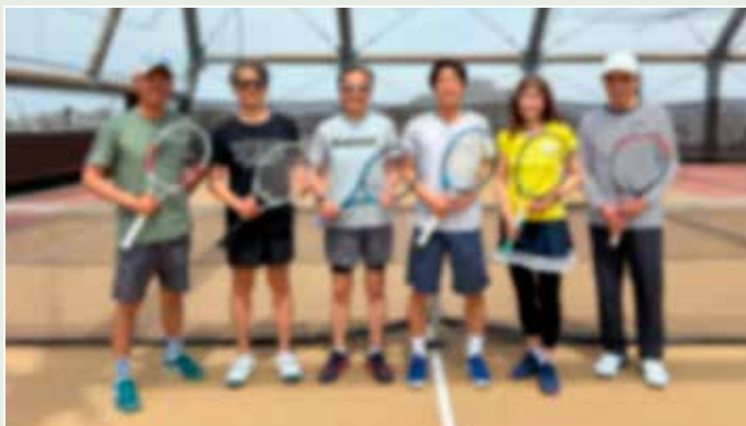
【第1部】(午前) 初心者・初級者の レッスンに 参加された皆様