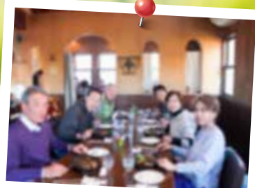
暖炉レストラン「ターシャ」

桜が少し遅かったのは、気候の為で、当日はスタッフがイベント内容を変更し、楽しませる工夫があったので、楽しかった。