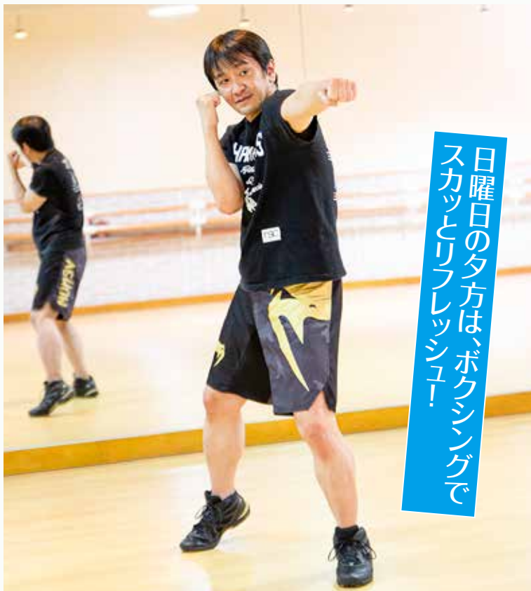
ジャブ 継続的なジャブのトレーニングは、全身の筋力を高め、身体のコントロールやパフォーマンスの向上に繋がります。