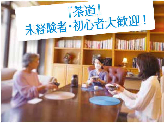
5月10日の講座の様子