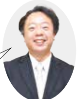
リバティヒルバケーション いわさき はるゆき 岩崎 治幸

洋上でゆったりくつろげる客室、充実したお食事、ダイナミックなショー、ラスベガススタイルのカジノ、多彩な船内プログラム等、きめ細やかなホスピタリティが自慢の船内プログラムが自慢のプレミアム船です。荷解きと荷造りは一度だけ、目覚めれば、そこは次の訪問地等メリットも大きいクルーズの旅。是非、ダイヤモンド・プリンセス号の旅をお楽しみ下さい!