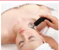
インディバ (デコルテ～肩～首)

60分【定価】 10,560 円(税込) ▶ 【キャンペーン価格】8,448円(税込)