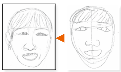
講師のアドバイス後 講師のアドバイス前

● 講師から「5分で描いて下さい。」と言われたので、そんな短時間で描けないと思いましたが、アドバイスを受けたら、それなりに描け、タッチまで変わるから不思議ですね。