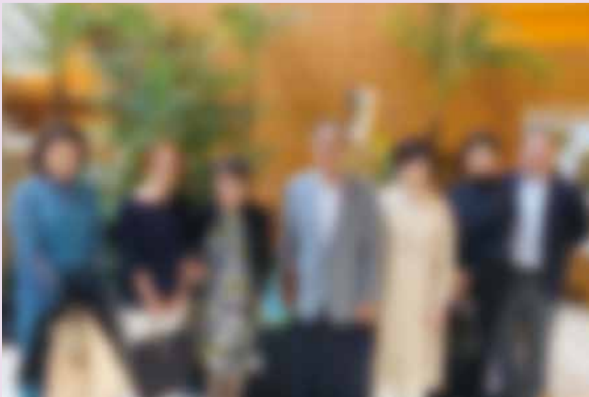
オペラ鑑賞会「リゴレット」に参加された皆様(新国立劇場ロビーにて)