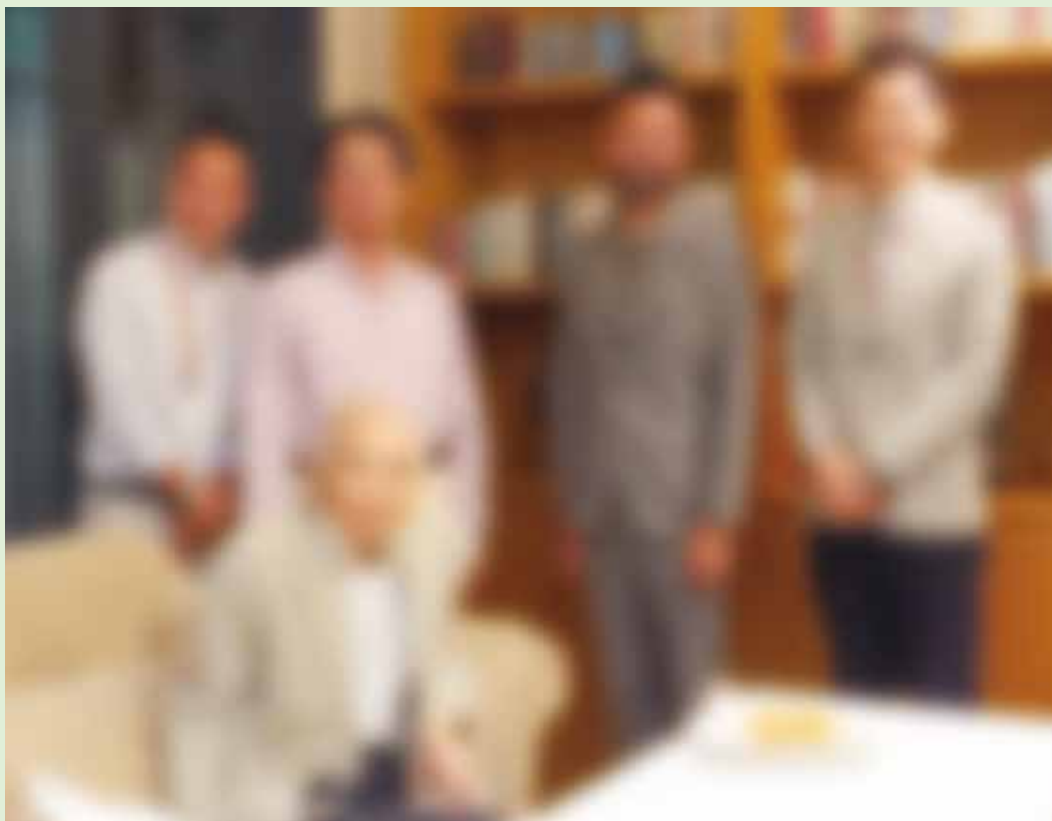
6月会にご参加された皆様(バースデーケーキの前に)