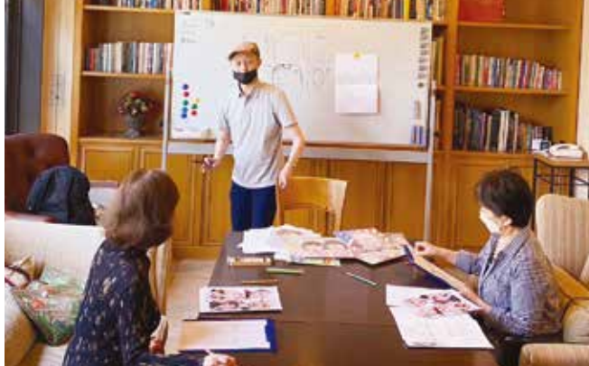
似顔絵教室第1回目(5月18日(木))の様子(上)と作品(下)