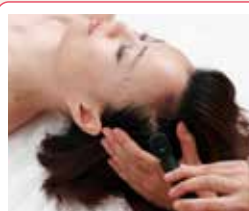
インディバ (前頭部～後頭部&側頭部)