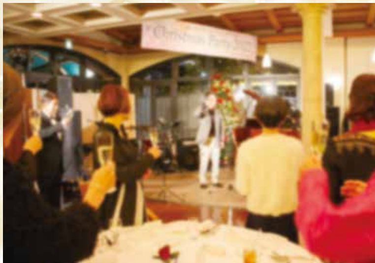
メンバーを代表より祝辞と乾杯のご発声を頂き、クリスマスパーティ2022がスタート!