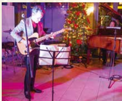
歓談中の生演奏では、ギターとピアノの レストラン「ソルフェージュ」による スムーズジャズを中心とした曲目を披露。スペシャルディナーはご好評頂きました。