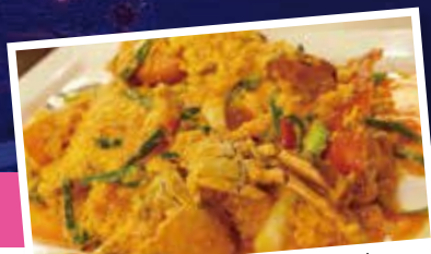
本場ソムブーンのパークパボンカレー。 蟹とふんわり卵のカレー炒めは美味

※12月中旬現在の情報を元にしております。今後、更に緩和される可能性がございます。最新情報は、リバティヒルバケーションへ。