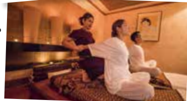
タイ古式マッサージの全身ほぐして、 リフレッシュ!スパと共に安らぎの空間