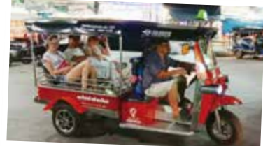
タイ名物トゥクトゥクでバンコクの雑踏の 中を疾走!EV化されつつあります