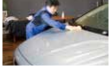
お車に汚れや傷を付けない様に、片方の手は後ろに回して作業。