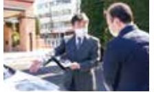
接客時は、スーツで対応

当クラブをご利用中に、カーコーティング技術1級認定を持った専門スタッフが、最短2時間で愛車をピカピカに仕上げます!