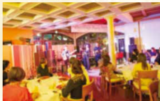
8つの円卓を配置し、ゆったりと歓談とお食事をお楽しみ頂きました。