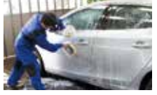
車に優しい中性洗剤を使用