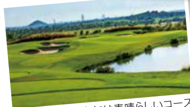
バンコクやパタヤには素晴らしいコース が沢山!専属キャディー付きます