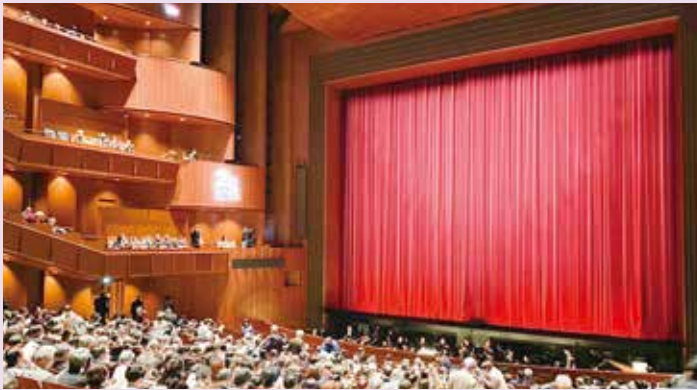
新国立劇場にてオペラ「ドン・ジョヴァンニ」を観劇 (午後／当クラブから、新国立劇場へ専用バスで移動)