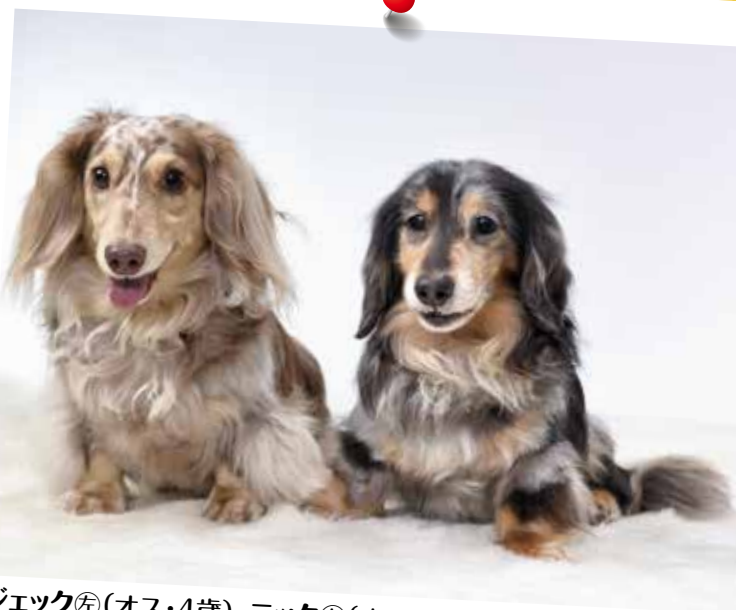
ジエック Ⓜ (オス・4歳)・ニック Ⓜ (オス・17歳11ヶ月)