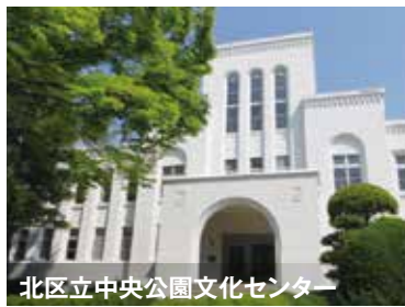
北区立中央公園文化センター