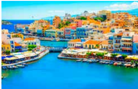
目黒通り側 クレタ島(ギリシャ)