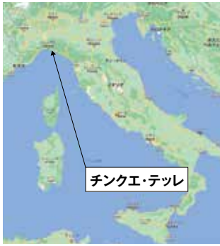
チンクエ・テツレ

イタリア北西部のリグーリア海岸にある5つの村を指す。ポルトヴェーネレや小島群等と共に、ユネスコの世界遺産に登録されている。また、ワインの産地としても知られています。