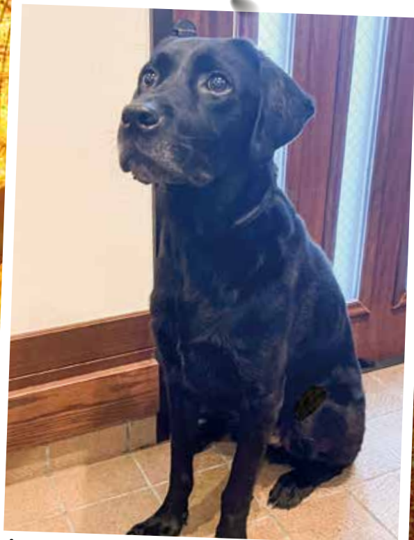
キャンディ(オス・4歳)