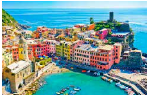
大マツ壁 チンクエ・テツレ(イタリア)

この壁紙のきっかけは、2015年のアニバーサリーパーティにさかのぼります。設立15周年という節目にあたり、パーティを2階のジムエリアで行う事になり、リゾートの雰囲気演出する為に、壁紙を貼りました。当初は、翌日に壁紙を取り外す予定でしたが、メンバーの皆様のご要望により、貼ったままとする事になりました。それ以降、毎年、異なる世界各地のリゾートの壁紙に差し替えています。是非、壁紙の風景を眺めながら、トレーニングをお楽しみ頂ければ幸いです。