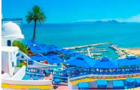
PTマツ壁 チュニス(チュニジア)