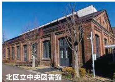
北区立中央図書館

ご家族・ご友人をお誘い合わせの上、ご参加下さい。皆様のご予約をお待ちしております。