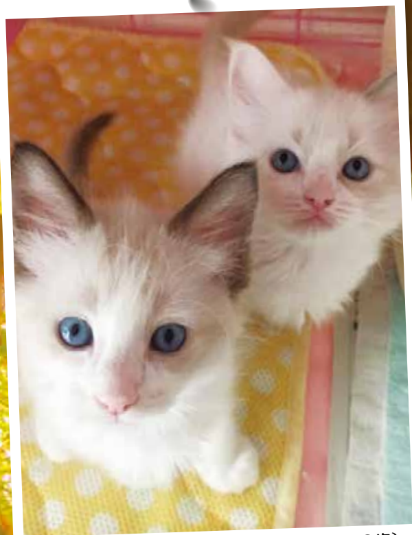
宇宙 Ⓜ (そら/オス・3歳)・サクラ Ⓜ (メス・3歳)