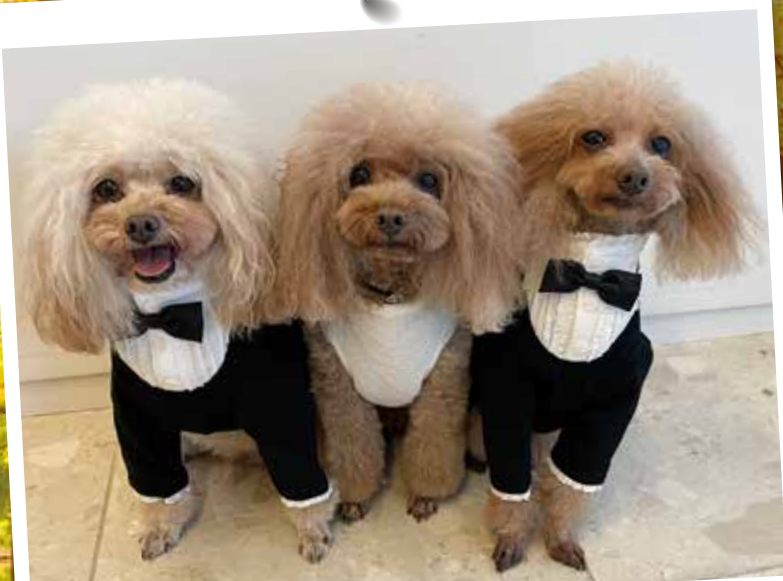
リアン Ⓜ (オス・3歳)・ランプ Ⓜ (メス・7歳)・ループ Ⓜ (オス・8歳)