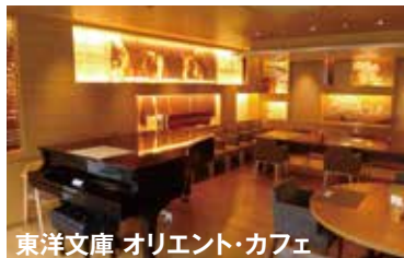
東洋文庫 オリエント・カフェ