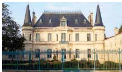
シャトー・パルメ Ch Palmer

第5級シャトーながら、第2級(非公認)と同等の格付けと見なされているランシュバージュ。ポイヤックの中でも優れた土地にブドウ畑を持っています。隣のシャトーホテルもお勧め！