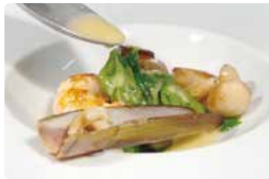
ル・パヴィヨン・デ・ブルバール(ボルドー市内) Le Pavillon des Boulevards 120 rue Croix-de Seguey, Bordeaux

ミシュラン1つ☆、ゴーミヨ-17点の高級店。お勧めは少量の10皿料理が試せるコースがあります。独創的なヌーベルキュイジーヌが楽しめるお店です！中心地ではないので、タクシーでどうぞ！