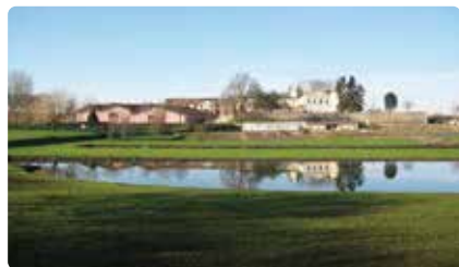
シャトー・ラフィット・ロートシルト Ch Lafite Rothschild

ボルドーワインの代名詞的存在であり筆頭のラフィット。樹齢100年以上のぶどうの木もあります。地下の円形貯蔵庫ではコンサートが開かれることもあります。