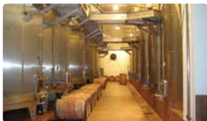
シャトー・ランシュバージュ Ch Lynch-Bages

メルローの比率が高くボルドーの貴婦人といわれ、シャネルが作った特注の樽やコレクションが展示されている博物館があります。