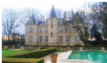
シャトー・ピションロングヴィルコンテス・ド・ラランド Ch Pichon-Longueville comtesse de Lalande

有名な塔が目印の5大シャトーのひとつ、ラトゥール。近年、館内が改装され一新され大変きれいな状態です。ここから眺めるジロンド川が美しい。