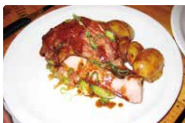
ランヴェール・デュ・デコー(サンテミリオン) L'avers du decor 11 rue du Clocher, Saint-Emilion

モノリッツ教会の楼塔の目の前にあるビストロノミー。地元の人々が集う店で、ランチミーティングをしながらワインを飲んでいる...実に、羨ましい！特級シャトーのオーナーの店で、マンガ「神の雫」にも登場したお店です！