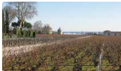
シャトー・ラトゥール Ch Latour

この超有名なマルゴー村のシンボルは、ボルドーのヴェルサイユと呼ばれています。誰もが訪れてみたいシャトーですが、一般の方は試飲が出来ない場合もあります。