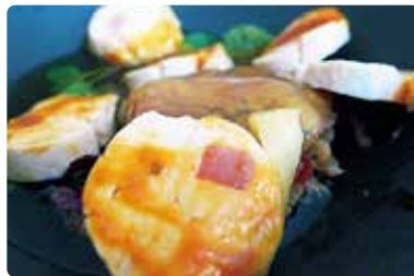
コルディアン・パージュ(メドック地区) Cordeillan-Bages Route des Chateaux Pauillac

おすすめ！シャトーホテルにあるレストランです。隣はシャトーランシュバージュですので、ブドウ畑のど真ん中に位置しています。ミシュラン2つ☆、ゴーミヨ-19点。充実したシャトー巡りの本拠地に！