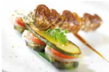
サンジェームス(ボルドー郊外) Saint-James 3 Place Camille-Hosteins, Bouliac

ボルドーから車で20分、ボルドー市内を見渡せる丘の上に建つデザインホテルにある注目のレストラン。最近、ミシュラン1つ☆から2つ☆へランクアップしたお店です！