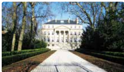
シャトー・マルゴー Ch Margaux

ボルドーワインの代名詞的存在であり筆頭のラフィット。樹齢100年以上のぶどうの木もあります。地下の円形貯蔵庫ではコンサートが開かれることもあります。