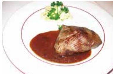
ビストロ・デュ・ソムリエ(ボルドー市内) Le Bistrot du Sommelier 163 rue Georges Bonnac, Bordeaux

いつも混雑していてなかなか入れない！とにかくワインリスト(ラフィットやムートンあり)が充実していて、他のお店よりも安く美味しいゴーミヨ-13点のおすすめ店です。カジュアルでお値段も非常に良心的なビストロノミーです！