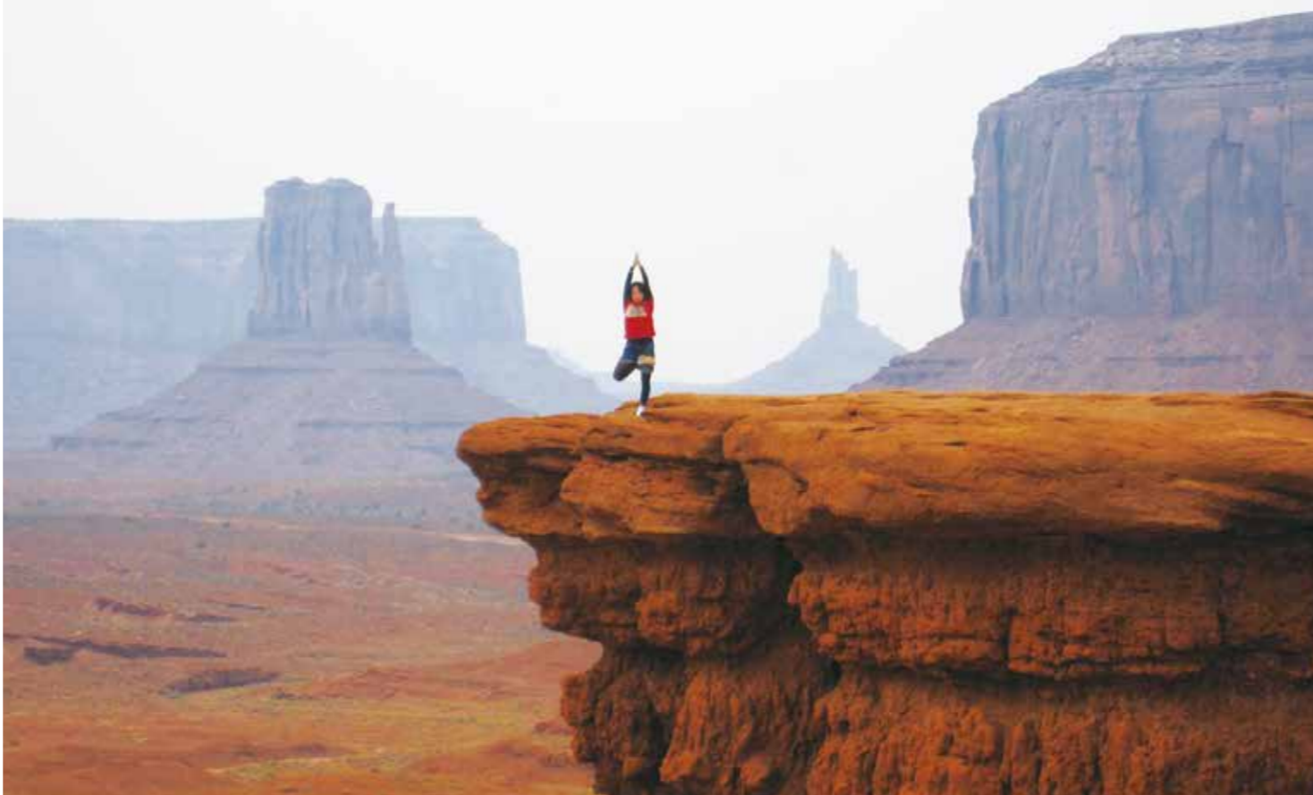
1 グランドキャニオンにて 2 カセドラルロックを正面に、瞑想(セドナにて) 3 アンテロープキャニオンにて 4 モニュメントバレーにて